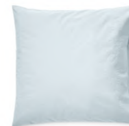
col. 70 powder blue