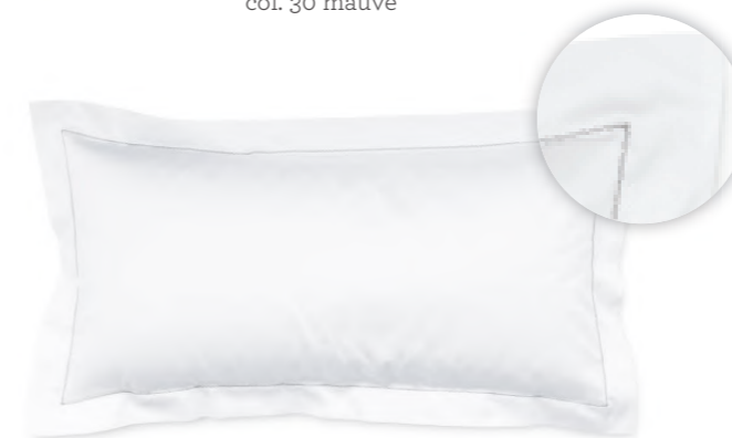
col. 61 basalt