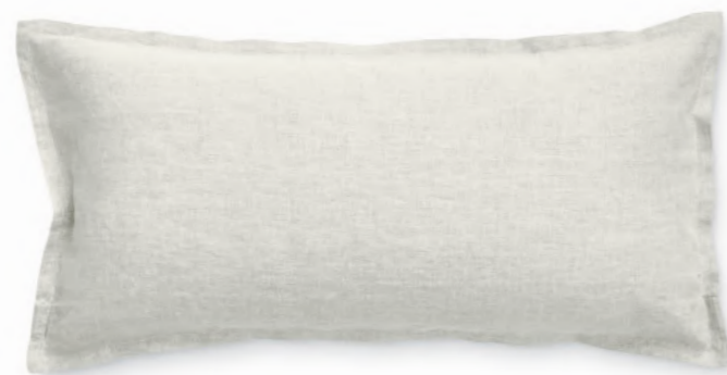
col. 20 natural