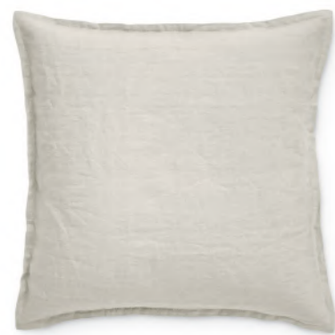
col. 20 beach