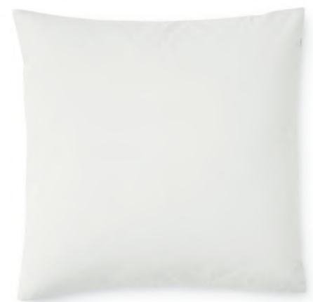
col. 60 pearl