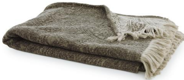
col. 80 ceder