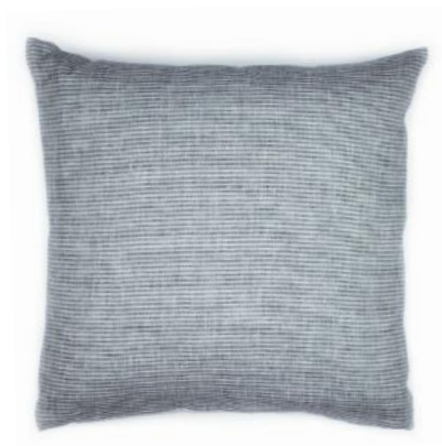
col. 70 storm