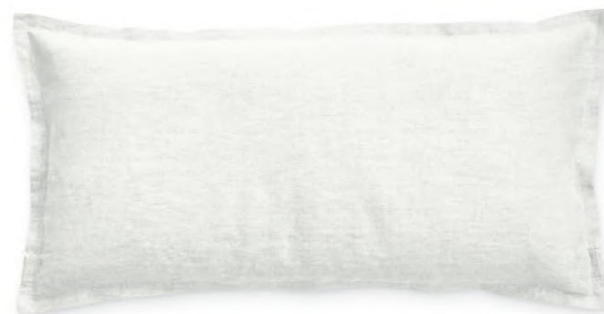
col. 10 ivory