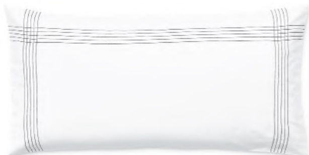
col. 61 basalt