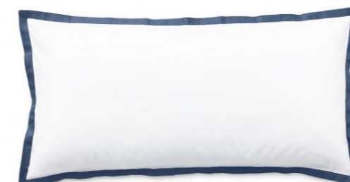
col. 70 harbour