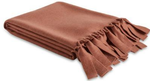
col. 80 ...