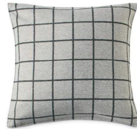
col. 600 grey

cooles Karo - warme Wolle | cool checks - warm wool