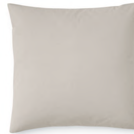
col. 80 greige