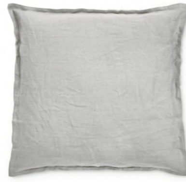
col. 61 fossil