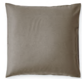
col. 80 etoupe