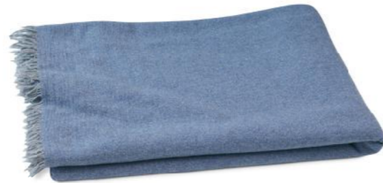
col. 70 boy