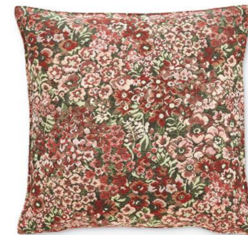
col. 350 rosé

ein Stück vom Paradies | a piece of paradise