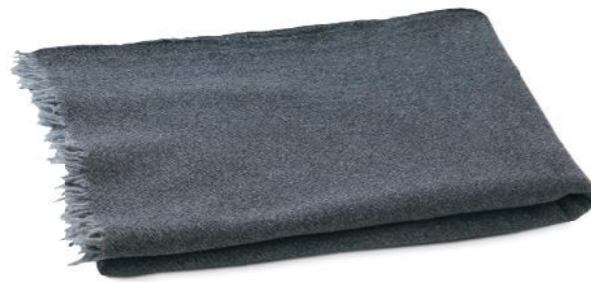
col. 61 casanova