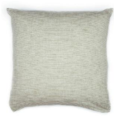
col. 80 nutmeg