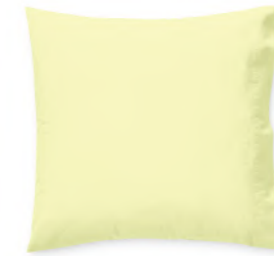
col. 40 key lime