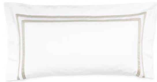
col. 20 sand