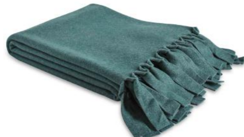
col. 51 ...