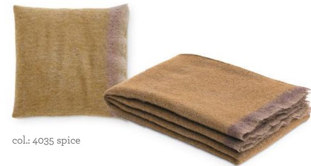
col.: 4035 spice