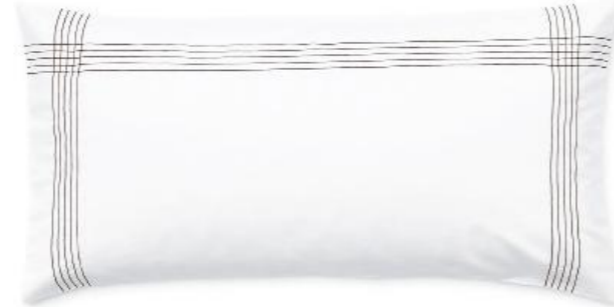
col. 80 etoupe