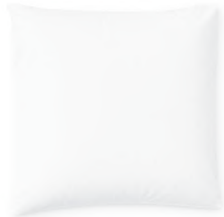
col. 00 snow