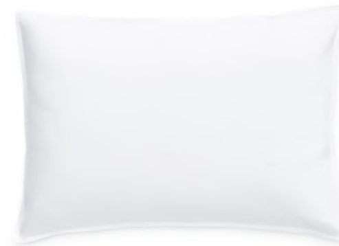
col. 00 white