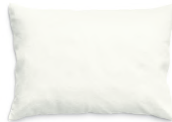
col. 10 ivory