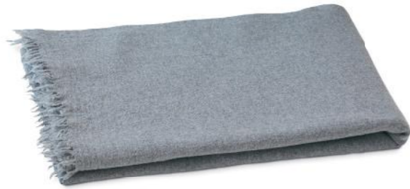
col. 60 grey