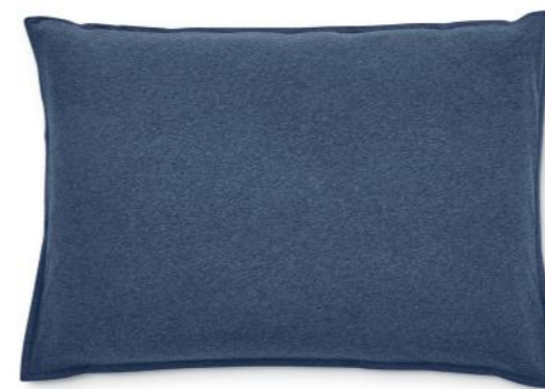
col. 70 denim melange