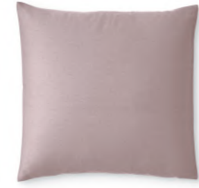
col. 30 mauve