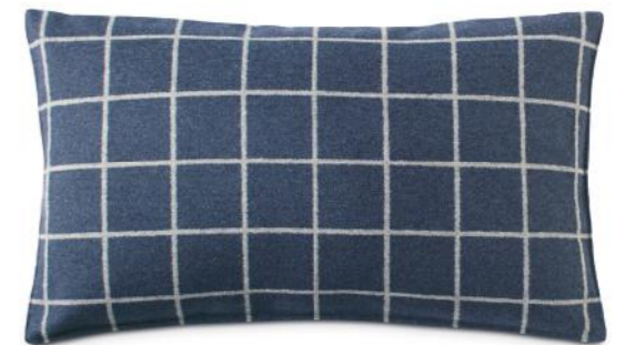
col. 700 marine