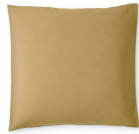
col. 41 spice