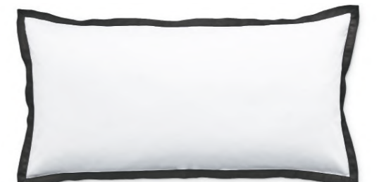
col. 90 black

Kissenbezug | pillow case: 40 x 80 / 80 x 80 cm Deckenbezug | duvet cover: 135 x 200 / 155 x 220 / 200 x 200 / 240 x 220 cm Material: 100 % Baumwolle (Satin) | 100% cotton (sateen)