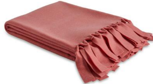
col. 30 ...