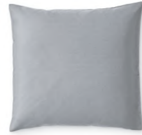
col. 61 basalt