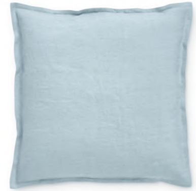
col. 70 heaven