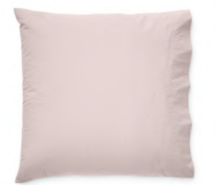
col. 30 vintage rosé