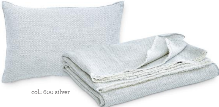
col.: 600 silver