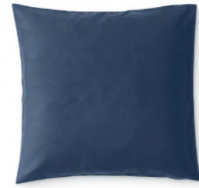
col. 70 harbour