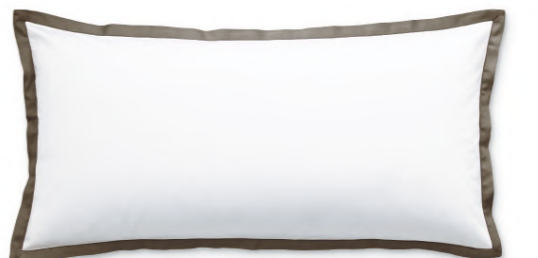
col. 80 etoupe