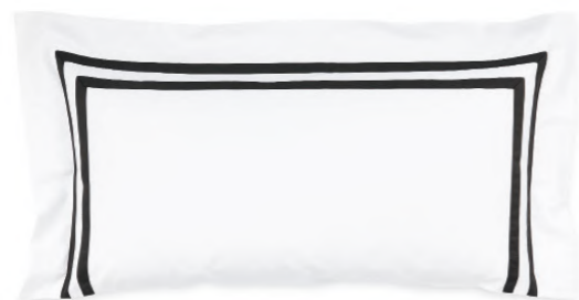
col. 90 black