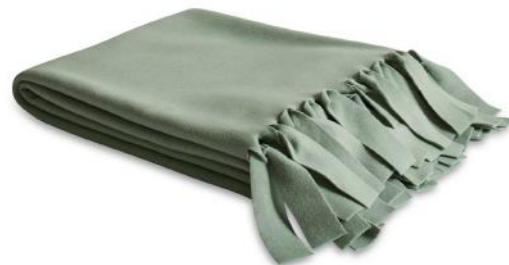
col. 50 ...