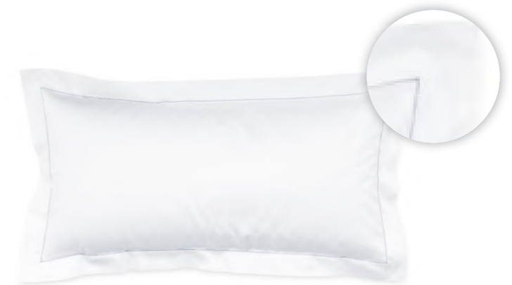
col. 70 harbour