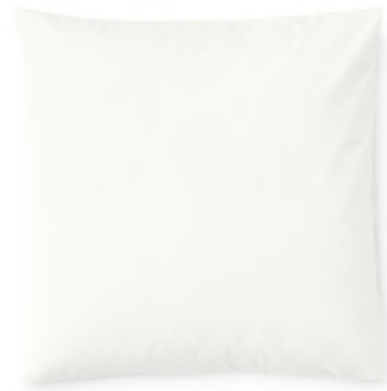
col. 10 rice