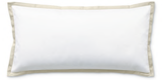
col. 20 sand