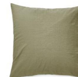
col. 51 like moss