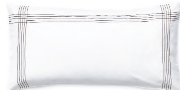
col. 90 black