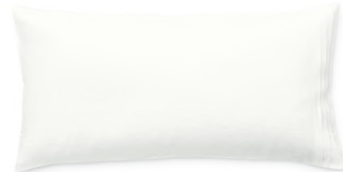
col. 10 ivory