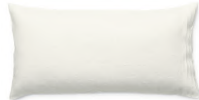
col. 20 natural

Kissenbezug | pillow case: 40 x 80 / 80 x 80 cm Deckenbezug | duvet cover: Siehe style six. | See style six. Spannlaken | fitted sheets: Auf Anfrage | on request Material: 100% Leinen | 100% linen