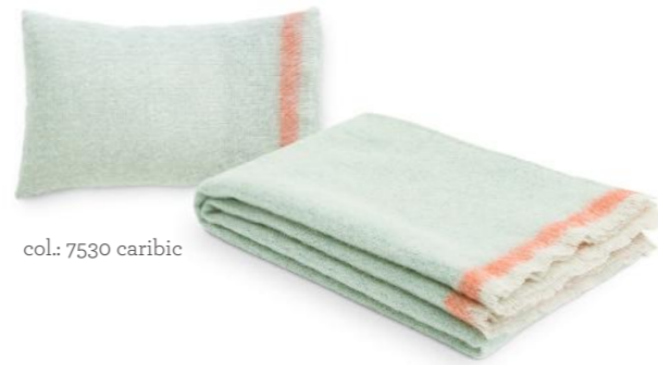
col.: 7530 caribic