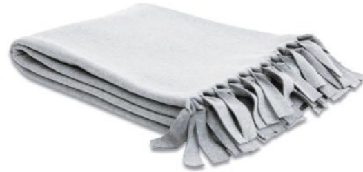
col. 60 grey melange