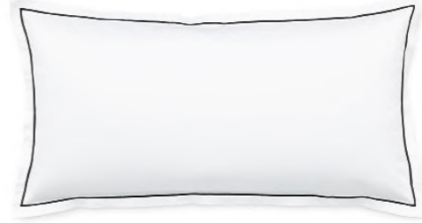
col. 90 black