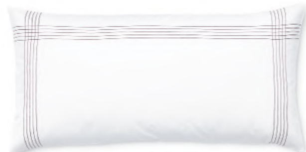
col. 30 mauve