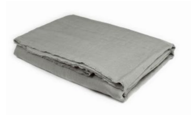
col. 61 fossil