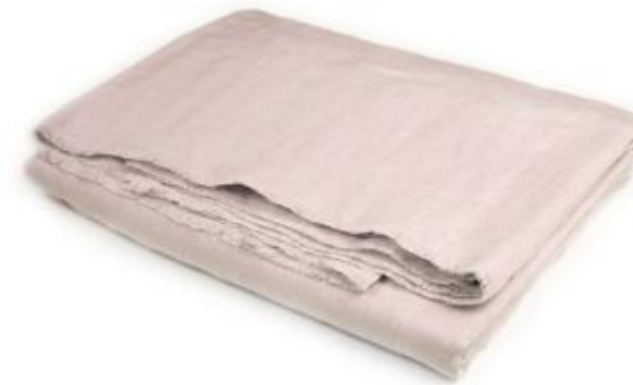
col. 30 rosé