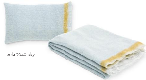
col.: 7040 sky

federleichter Flauschfaktor | featherweight fleece factor