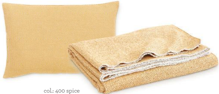
col.: 400 spice

Kissenbezug | decorative pillow case: 30 x 40 / 30 x 50 / 40 x 40 / 40 x 60 / 50 x 50 cm Überwurf | Throw: 80 x 240 cm / 160 x 230 cm / 240 x 265 cm / 275 x 265 cm / 300 x 265 cm Material: 79% Baumwolle, 21% Polyacryl | 79% cotton, 21% polyacryl