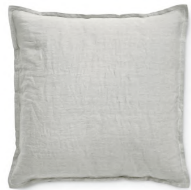
col. 80 greige