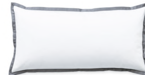
col. 61 basalt