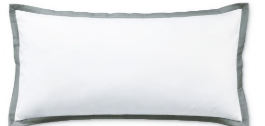
col. 63 greige