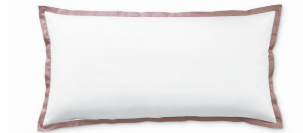
col. 30 mauve