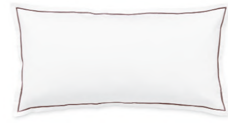
col. 30 mauve