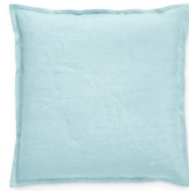
col. 75 pool