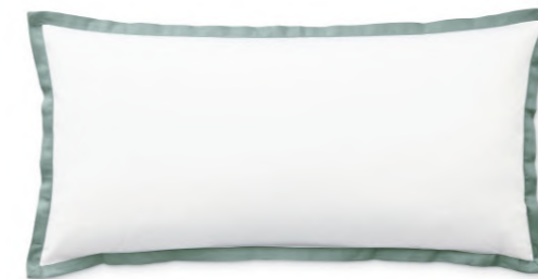
col. 50 fjord