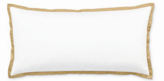
col. 41 spice