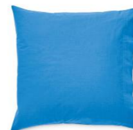
col. 71 vibrant blue