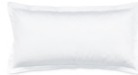
col. 00 white