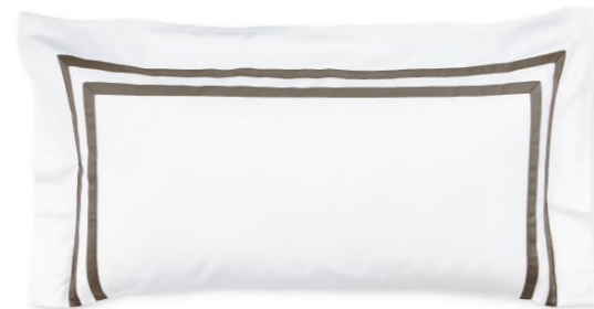
col. 80 etoupe