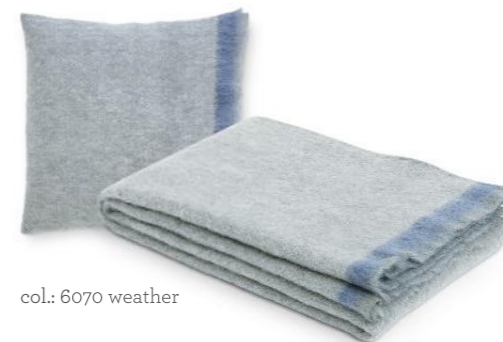
col.: 6070 weather