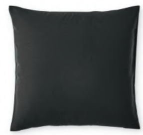
col. 90 black