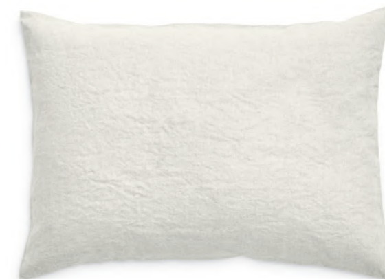
col. 20 natural

Kissenbezug | pillow case: 40 x 40 / 40 x 80 / 50 x 70 / 65 x 100 / 70 x 90 / 80 x 80 cm Deckenbezug | duvet cover: 135 x 200 / 155 x 220 / 160 x 210 / 200 x 200 / 200 x 210 / 240 x 220 cm Spannlaken | fitted sheets: Auf Anfrage | on request Material: 100 % Leinen | 100% linen