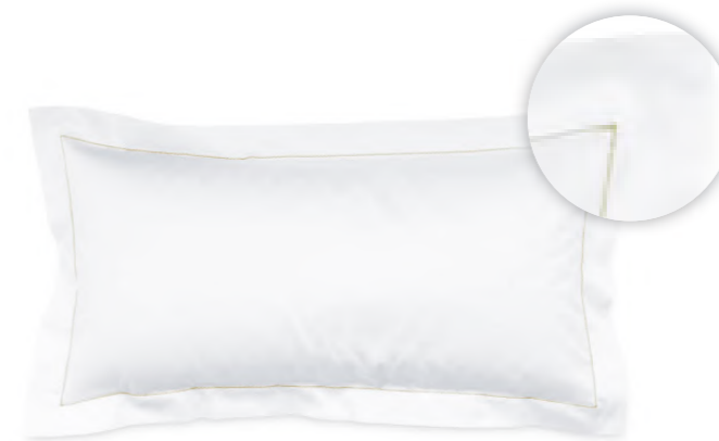
col. 20 sand