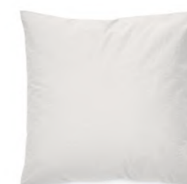
col. 60 smoky grey