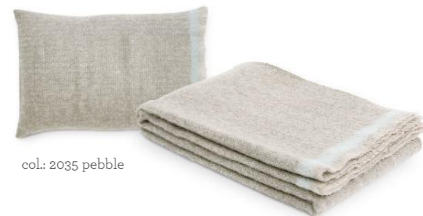
col.: 2035 pebble