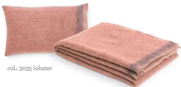
col.: 3035 lobster