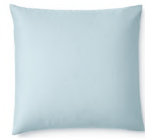
col. 72 dove