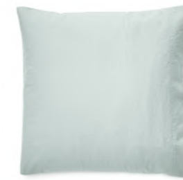
col. 50 mystery green