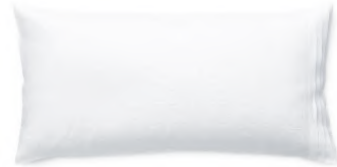
col. 00 white