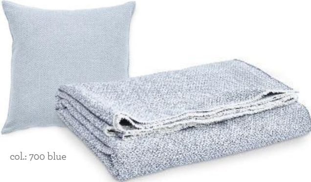
col.: 700 blue