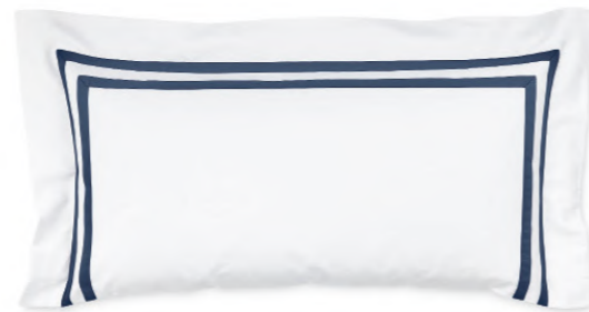
col. 70 harbour