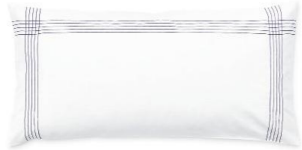
col. 70 harbour