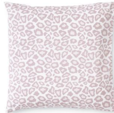
col. 30 mauve