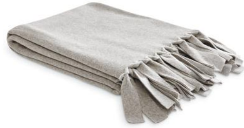
col. 20 cookie dough

dekorativer Anknüpfungspunkt | decorative connecting point