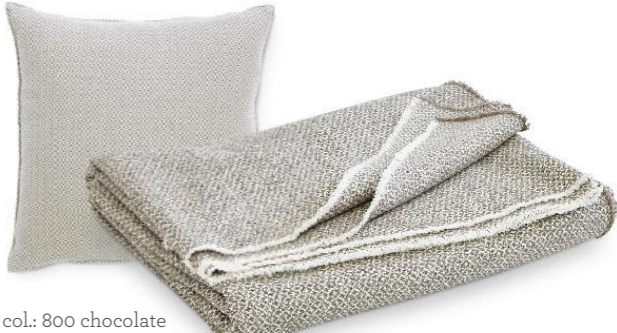
col.: 800 chocolate