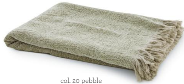
col. 20 pebble

fließende Faszination | fluent fascination