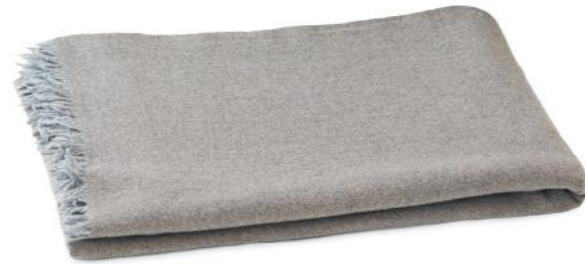
col. 20 tundra