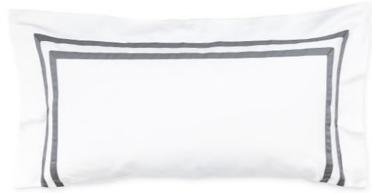
col. 61 basalt