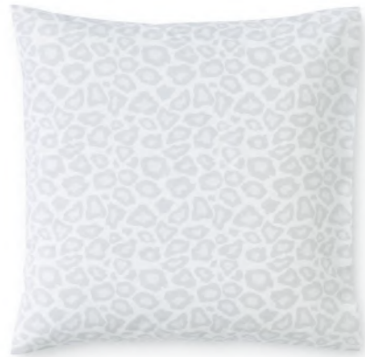
col. 60 silver