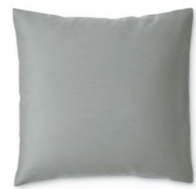
col. 63 greige