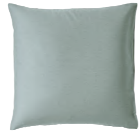
col. 50 fjord