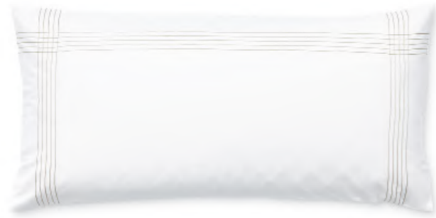
col. 20 sand