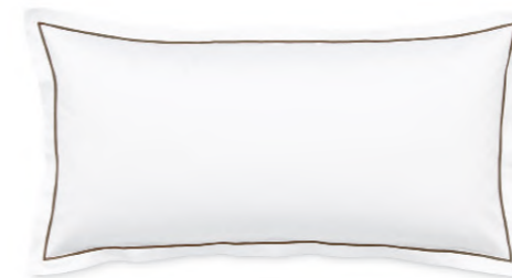
col. 80 etoupe