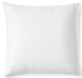
col. 60 silver