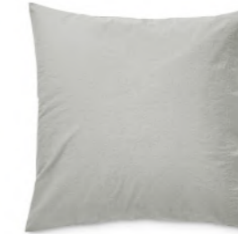
col. 80 like thunder