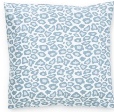
col. 51 blue