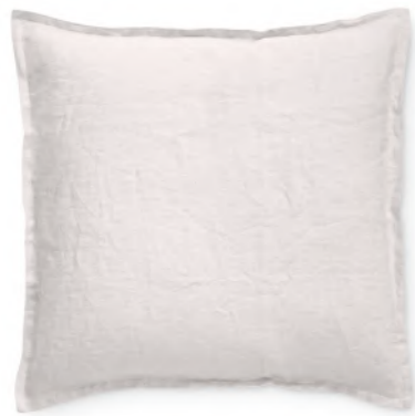
col. 30 rosé