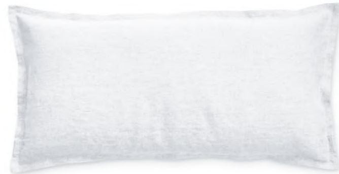
col. 00 white