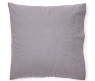
col. 35 purple rain