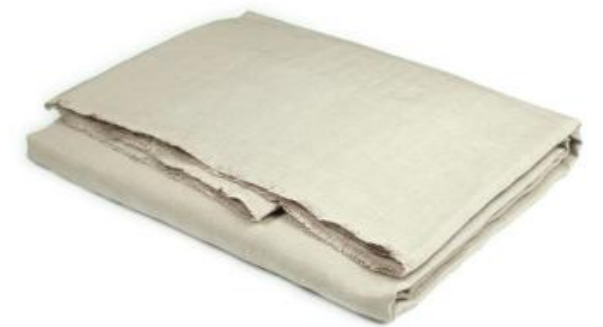
col. 20 beach