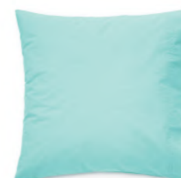
col. 75 lazy lagoon