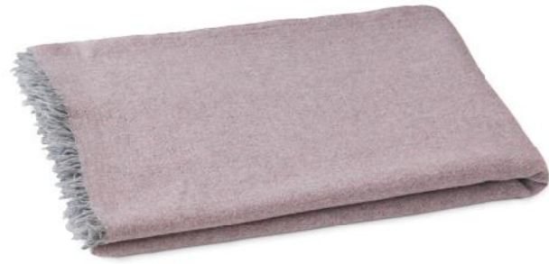
col. 30 lady like

lässig leichtes Plaid | casual light throw