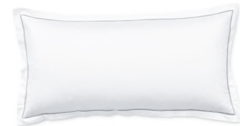
col. 61 basalt