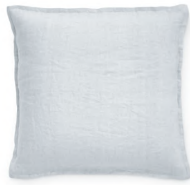
col. 60 platinum