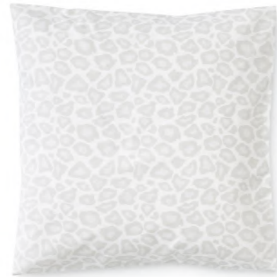
col. 21 natural