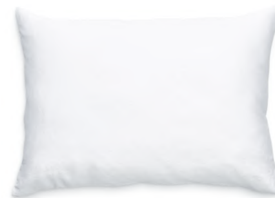
col. 00 white