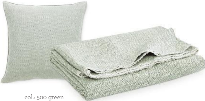
col.: 500 green