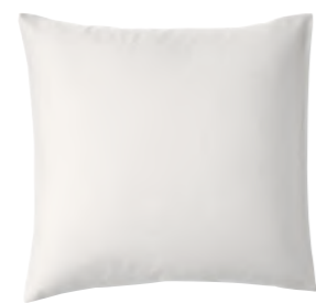
col. 62 mouse