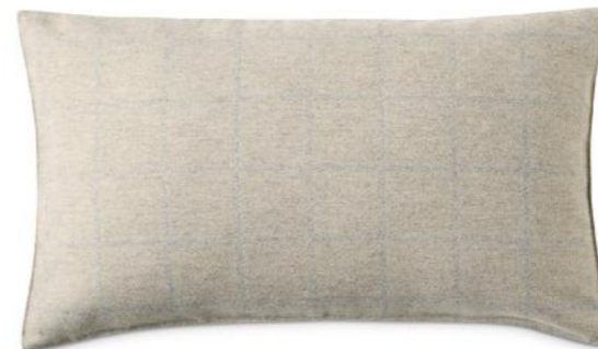
col. 200 dust