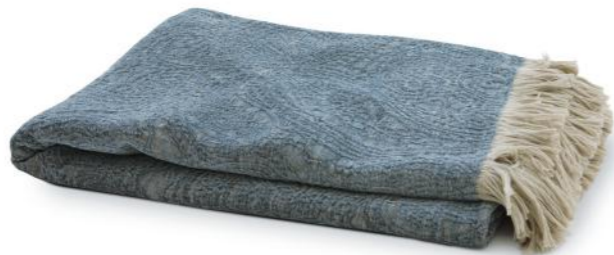
col. 70 blue