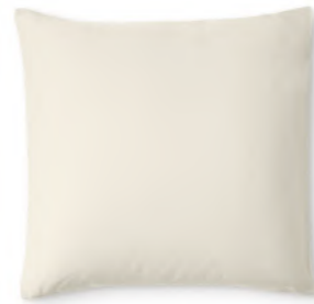
col. 20 sand