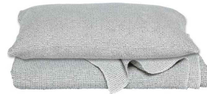
col. 72 sky

Kissenbezug | decorative pillow case: 40 x 40 / 50 x 50 / 40 x 60 cm Überwurf | throw: 80 x 240 cm / 160 x 230 cm / 240 x 265 cm / 275 x 265 cm / 300 x 265 cm Material: 100% Baumwolle | 100% Cotton