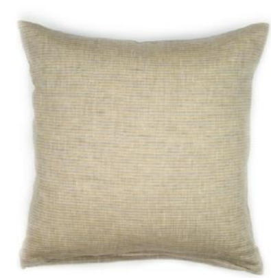
col. 40 spice