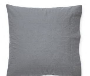
col. 62 solid grey

Kissenbezug | pillow case: 40 x 40 / 40 x 80 / 50 x 70 / 65 x 100 / 70 x 90 / 80 x 80 cm Deckenbezug | duvet cover: 135 x 200 / 155 x 220 / 160 x 210 / 200 x 200 / 200 x 210 / 240 x 220 cm Spannlaken | fitted sheets: Auf Anfrage | on request Material: 100% Baumwolle (Perkal, stonewashed) | 100% cotton (stonewashed percale)