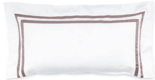
col. 30 mauve