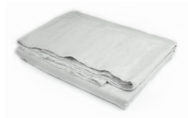
col. 60 platinum

legerer Überwurf aus Leinen | casual throw made of linen