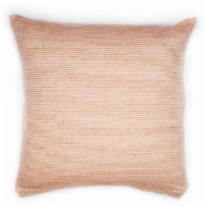
col. 35 rosewood