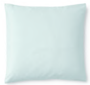
col. 75 arctic