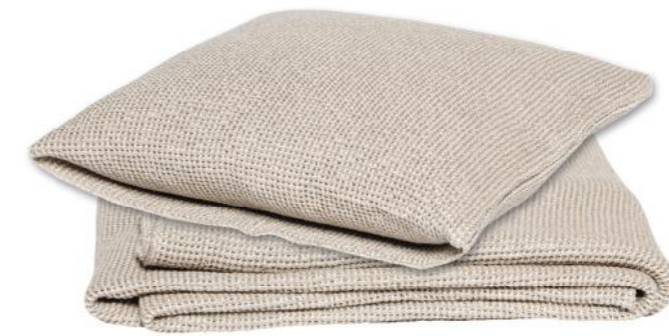
col. 21 natural

wohlig-weicher Waffellook | soft and comfy waffle look