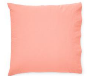
col. 31 cool coral