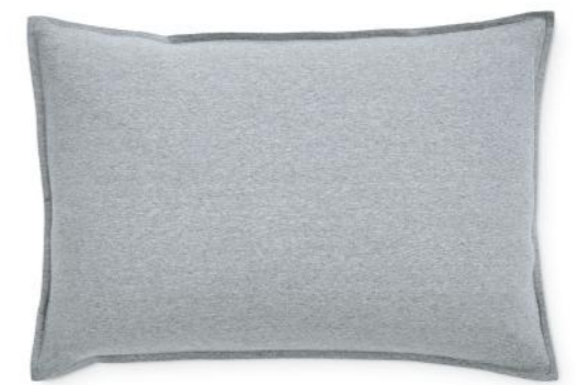
col. 60 melange grey