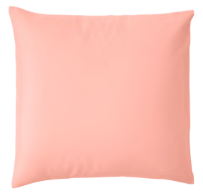
col. 31 flamingo