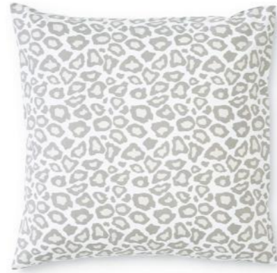
col. 80 étoupe