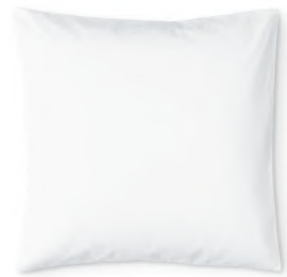
col. 00 white