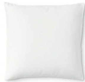
col. 10 ivory