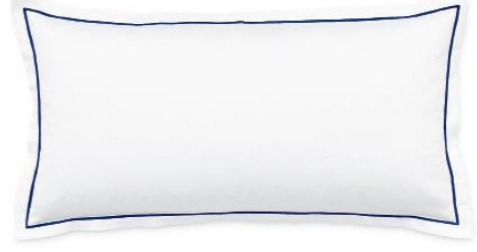
col. 70 harbour