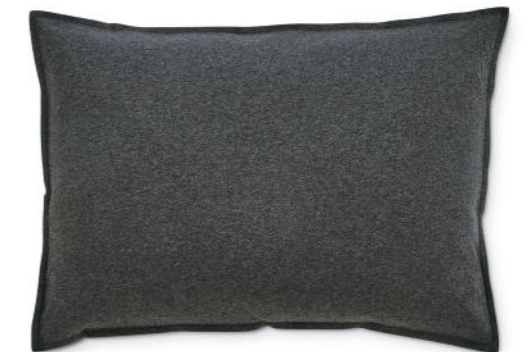
col. 61 melange anthracite

Kissenbezug | pillow case: 40 x 40 / 40 x 80 / 50 x 70 / 80 x 80 cm Deckenbezug | duvet cover: 135 x 200 / 155 x 220 / 200 x 200 cm Material: 100% Baumwolle (Jersey) | 100% cotton (jersey)