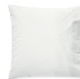
col. 61 frosty silver