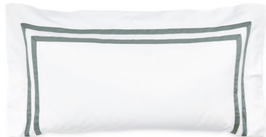
col. 50 fjord