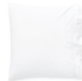
col. 00 snow white