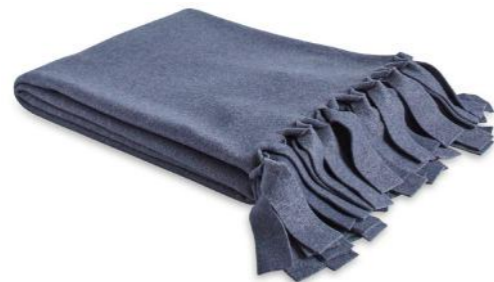
col. 70 ...