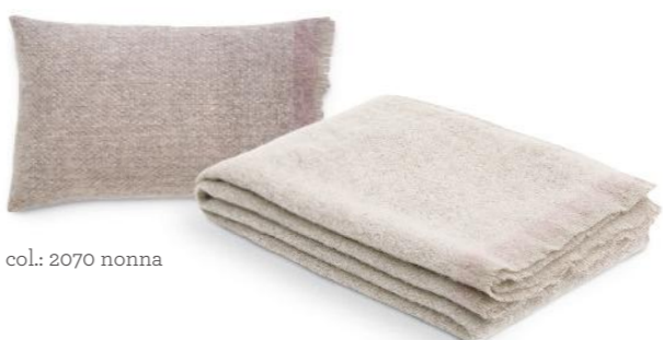
col.: 2070 nonna